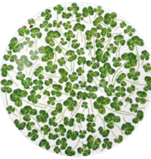
12-22-6 Portata Rotondo - Segnaposto Round Platter - Chop h 2 cm | Ø 31 cm

Your lucky charm for every moment. BEAUTIFUL DAY infuses every daily gesture with joy and good fortune: from Breakfast to Happy Hour. Four-leaf clovers and ladybugs create a perfect harmony between elegance and Italian spirit, between sophisticated preciousness and joie de vivre. The new TAITÙ Collection reaches far beyond the table. New and versatile shapes - such as the Rectangular Plate and the small, but surprisingly generous Bowl - adapt to endless uses, transforming BEAUTIFUL DAY into a Collection of treasures to be lived, gifted, and cherished. The creative twist? The Small Plate featuring a maxi four-leaf clover: a surprising detail that amplifies the “lucky” spirit of the Collection. Because with TAITÙ, good luck has never looked so chic.