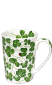
12-22-4 Mug h 12 cm | Ø 9 cm 450 ml