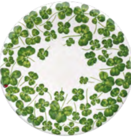
12-22-1 Frutta - Dessert Salad h 1.5 cm | Ø 21.5 cm