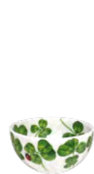
12-22-93 Ciotolina Pinch Pot h 3.5 cm | Ø 7 cm