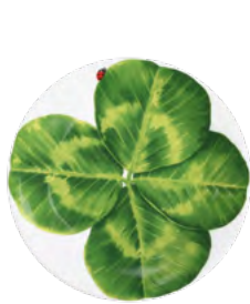
12-22-3 Piattino Small Plate h 2 cm | Ø 17 cm