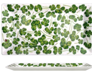
12-22-9 Piatto Rettangolare Rectangular Plate h 1.5 cm | 29x16 cm

* Disponibile su ordinazione - Available upon request