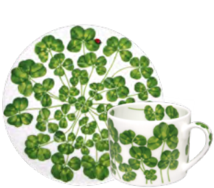
12-22-2 Tazza Tè - Cappuccino & Piattino Tea - Coffee c/s Cup h 6.5 cm | Ø 9 cm | 230 ml Saucer Ø 17 cm