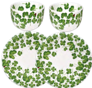
2 x Small Bowl 2 x Salad-Dessert Plate