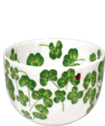
12-22-50 Ciotola Piccola Small Bowl h 7.5 | Ø 13.5 cm | 600 ml