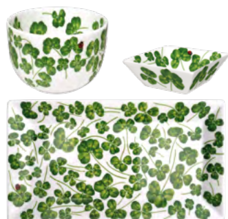
1 x Small Bowl 1 x Squared Pinch Pot 1 x Rectangular Plate