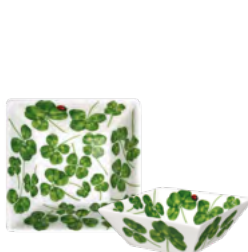
12-22-14 Ciotolina Quadrata Squared Pinch Pot h 4 cm | 9.5 x 9.5 cm