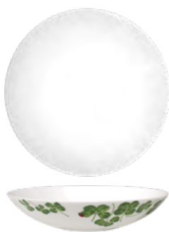
* 12-22-5-B Fondo Coupe Soup h 4.5 cm | Ø 20.5 cm