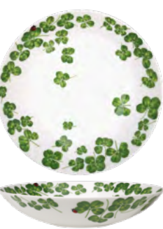
12-22-5-A Fondo Coupe Soup h 4.5 cm | Ø 20.5 cm