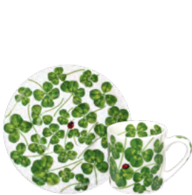
12-22-91 Espresso & Piattino Espresso c/s Cup h 5.5 cm | Ø 6 cm | 100ml Saucer Ø 12.5 cm