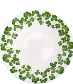
12-22-0-A Piano Dinner h 2 cm | Ø 28 cm