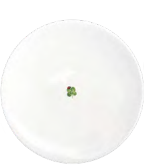
* 12-22-0-B Piano Dinner h 2 cm | Ø 28 cm